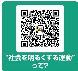
“社会を明るくする運動” って?