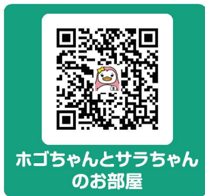
ホゴちゃんとサラちゃん のお部屋